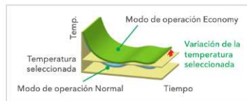
Modo de funcionamiento económico.