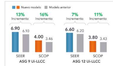
Altos valores SEER y SCOP

El termostato sube la temperatura seleccionada gradualmente 1°C en refrigeración y ayuda a controlar el gasto energético.